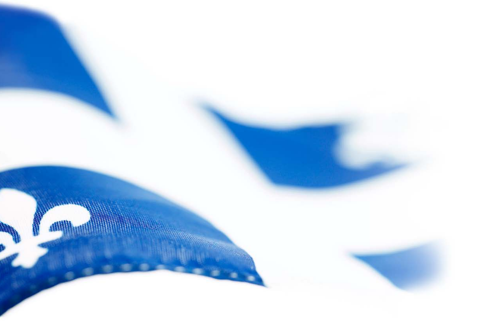
Tableau de bord de la région métropolitaine de Montréal – Édition 2016